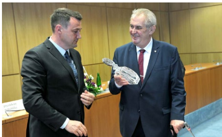
Hejtmán daroval prezidentovi broušenou karafu s rytým motivem českého dvouocasého lva od firmy Halama Železný Brod naplněnou jeho domácí hruškovici.