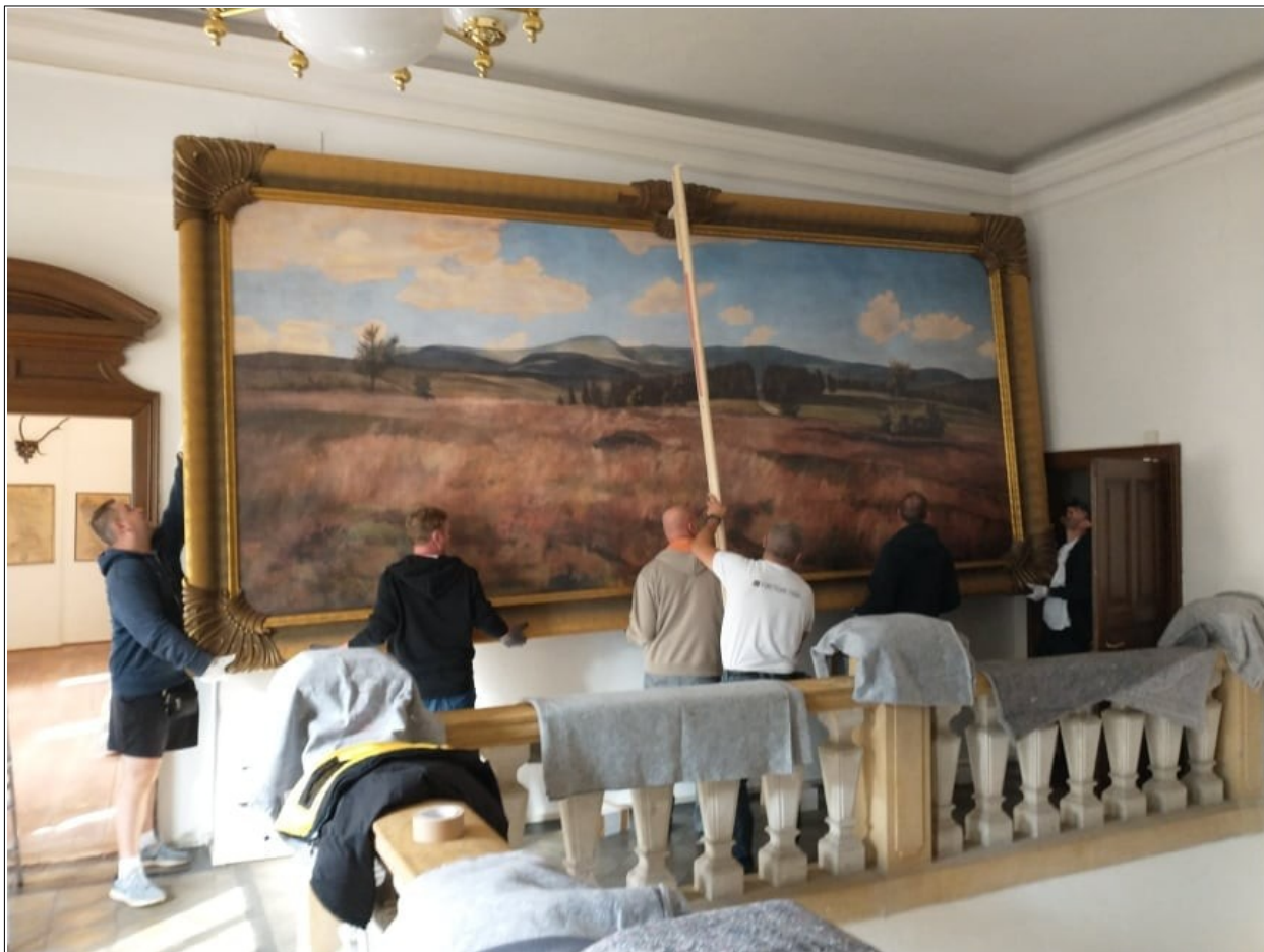
Kavánův Podmrak se už vrátil z Liberce do Jilemnice.

rekonstrukcí za bezmála 64 milionů ulice Žižkova, která do Krkonošské ulice ústí; o úpravu vozovky se postaral Liberecký kraj, město Jilemnice hradilo ze svého rozpočtu vybudování nových chodníků, část veřejného osvětlení nebo vegetační úpravy. Zároveň se finančně podílelo na vzniku retenční nádrže a dešťové kanalizace. (Liberecký kraj)