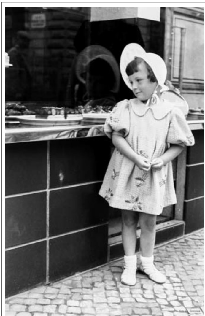
Z otevření Cukrárny U Nyčů, 30. léta.

V Krkonošské ulici se objevil první semafor v historii vměsta. Je na rušné krajské silnici číslo 286 a umožňuje chodcům bezpečně přejít významnou jilemnickou dopravní tepnu. Je to další krok k tomu, aby se pěší i motoristé cítili ve městě lépe – už v minulosti prošla