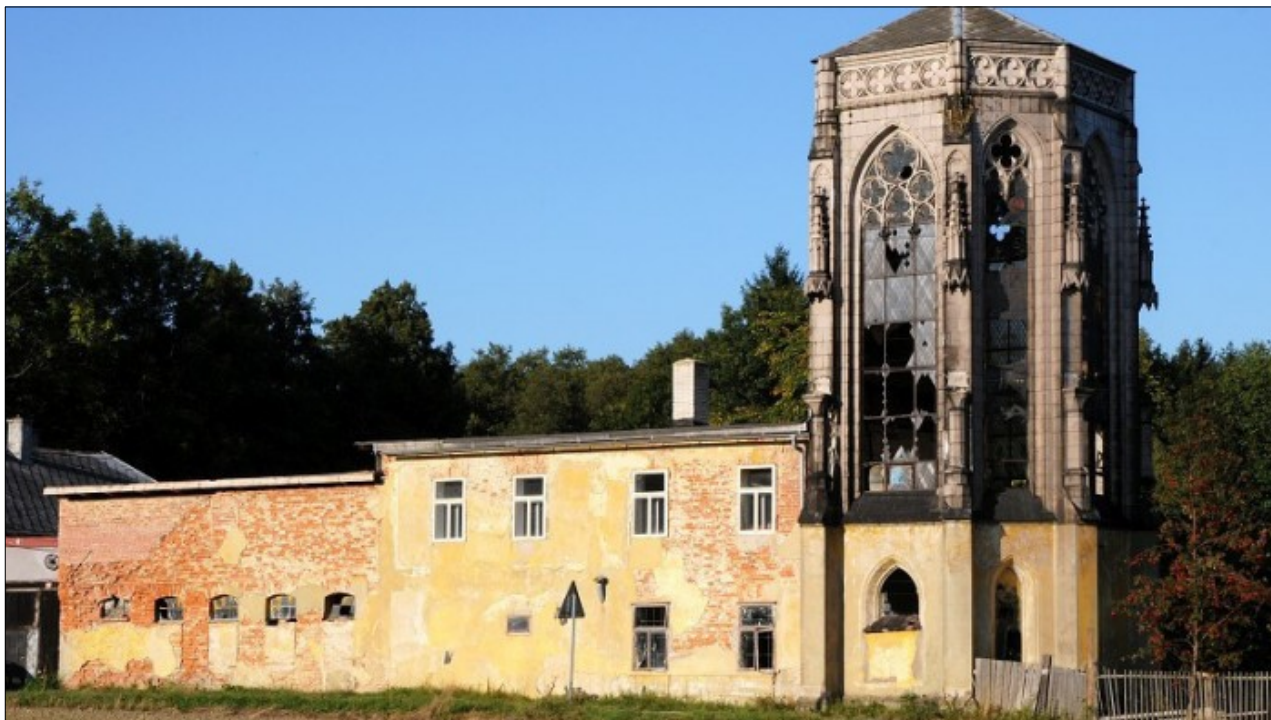
/Jan Mikulička, Liberecký kraj

První informace o kostelu pochází z roku 1352. V roce 1752 byl uváděn jako kamenná stavba s dřevěnou střechou pokrytou šindelem. V roce 1785 započala přestavba kostela, která částečně skončila v roce 1795. Zkraje 19. století se ve stavebních pracích pokračovalo. Došlo k rozšíření hřbitova, opravě věže, výměně střešní krytiny a k výstavbě nové hřbitovní zdi. Ve 20. století byly do kostela převezeny varhany ze zdevastovaného kostela v Horní Libchavě.