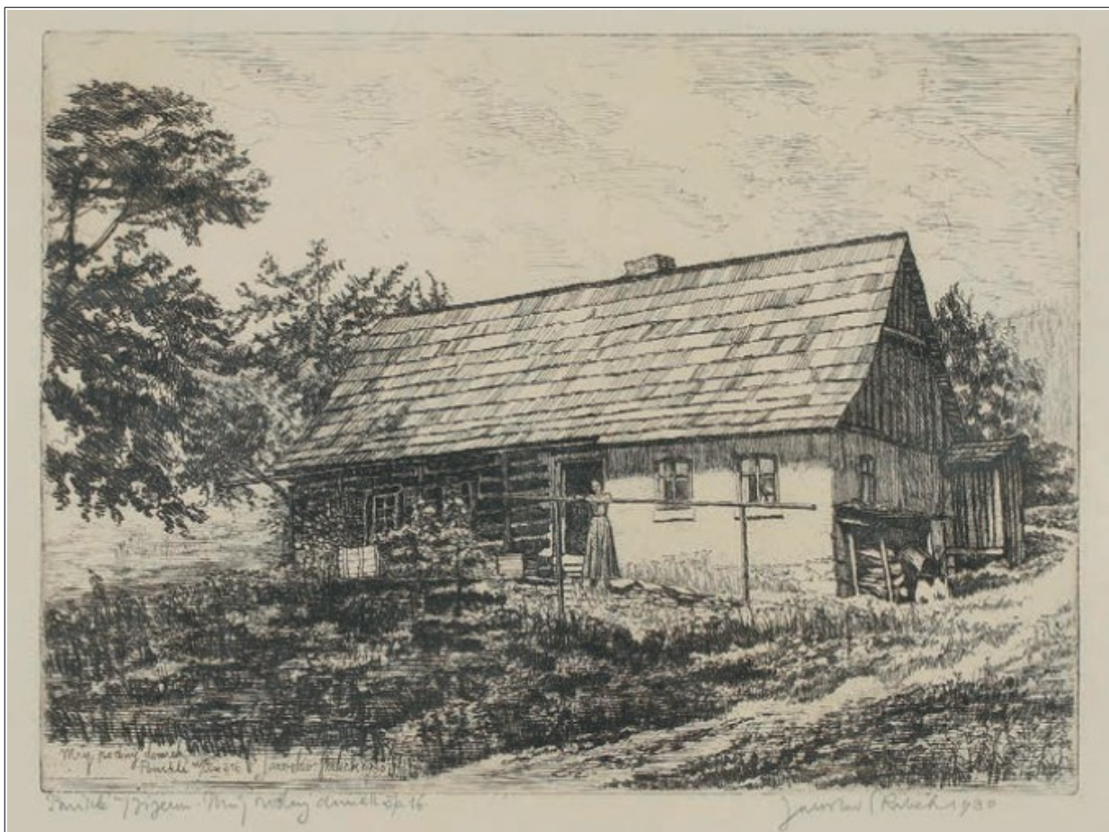
Můj rodný domek v Poniklé čp. 16, rok 1930

A i když zde poznal strasti chudého studenta, zdejší prostředí na jeho umělecký vývoj mělo značný vliv. Pod dohledem gymnaziálního profesora se pustil s vervou sobě vlastní do kreslení doma i v plenéru. Aby ulehčil rodičům, začal si velmi brzy přivydělávat doučováním spolužáků. Rovněž sem tam prodal i nějakou ze svých prvních prací. Dokonce i dr. Vincenc Kramář z Vysokého si od něj jednu z jeho kreseb koupil za zlatou desetikorunu. Pod vlivem uměleckých časopisů, které si kupoval za vydělané peníze a které mu zajišťovaly souvislý kontakt s tehdejší českým i světovým uměním, se rozhodl, že musí jet do Prahy, mekky umění. Zážitky z cesty do hlavního města o pololetních prázdninách roku 1905 vedly k nezvratnému rozhodnutí pokračovat ve studiích právě v Praze. A to na své vlastní náklady.