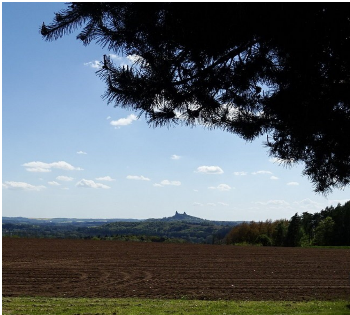
Z Tatobit od Studničků