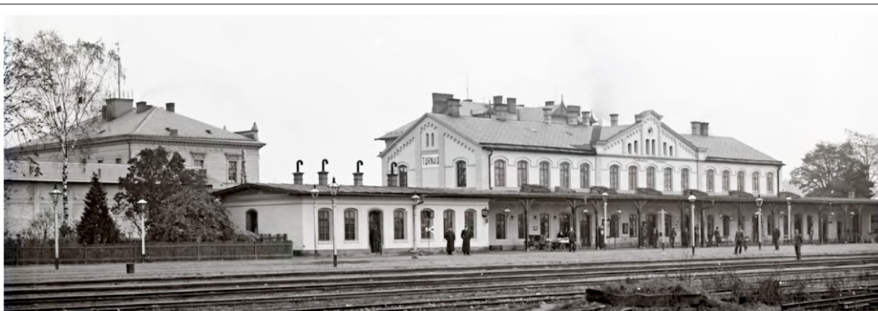
Turnovské nádraží na přelomu 19. a 20. století