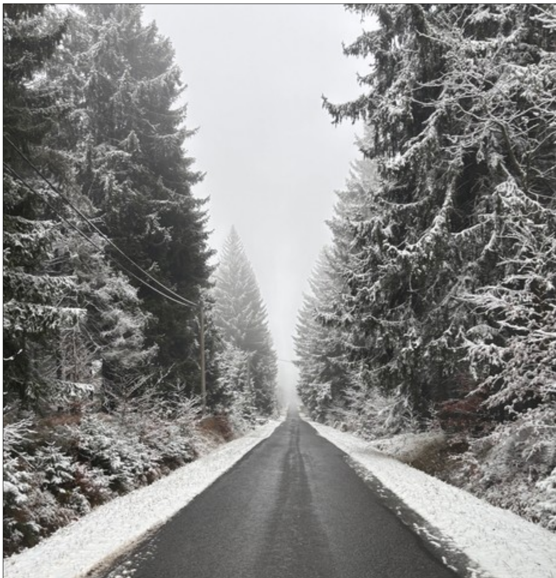
Na úpatí Černé Studice