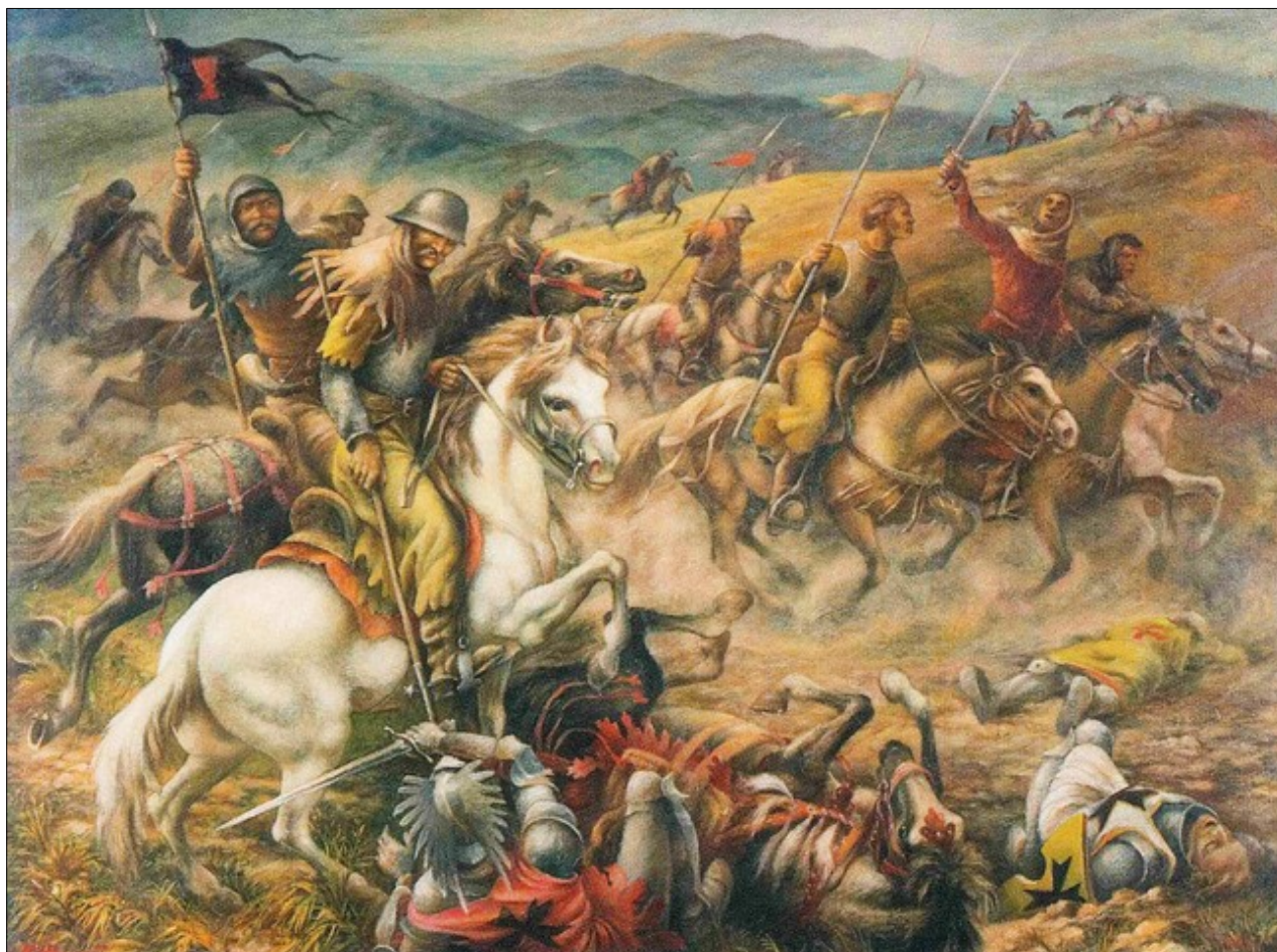
V Hanuš - Útok husitské jízdy, olej, 1952 - sbírka MMaG Lomnice nad Popelkou

Cyklus podzimních muzejních přednášek pro letošní rok uzavírá další s historickým podtextem. O „Husitství ve Východních Čechách“ přijede do Lomnice pohovořit profesor Petr Čornej, významný český historik specializující se na dějiny pozdního středověku, jenž se zaměří na kořeny východočeského husitství, na jeho mocenský rozmach pod vedením válečníka Jana Žižky i na působení sirotčího svazu. Akce se koná v úterý 26. listopadu opět od 17 hodin. Vstupné na obě přednášky je dobrovolné.