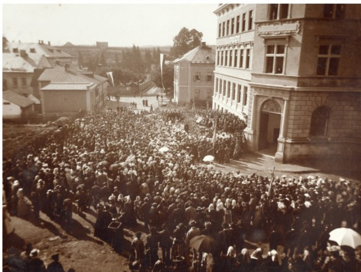
Otevření školy 24. září 1899.

Zkušenosti z nedávné stavby radnice (1888–1893) ukázaly, že základy stavby v mokrém terénu je nutno důkladně vyztužit. Proto vznikl nejprve důkladný rošt z dubového dřeva. Jednotlivé piloty se vrážely hluboko do země. Náročný přístup se vyplatil, neboť budova nikdy neměla statické problémy. Architekt využil důsledně stylu české novorenesance. Okna zdůrazňují pěkně modelované suprafenestry, hlavní vchod je umístěn do mohutného rizalitu s velmi hezkým portálem. Nad II. poschodím vidíme krásnou lunetovou římsu a nad ní atiku. Siluetu budovy umocňují komíny, vikýře a pro Vejrycha typická věž s ochozem a věncem chrličů, zakončená velkým zlaceným křížem. V interiéru si zaslouží pozornost centrálně zaklenutá vstupní hala s mramorovou pamětní deskou, na níž je mimo jiné uvedeno, že škola byla pojmenována podle panujícího císaře Františka Josefa I. Schodiště lemuje bohatě zdobené zábradlí. Na stěnách ve vstupní hale a na podestách se dochovaly malby jilemnického malíře Jana Lva (Leva), zachycující místní a krkonošské motivy. Škola byla 24. září 1899 za veliké účasti veřejnosti slavnostně vysvěcena a předána svému účelu.