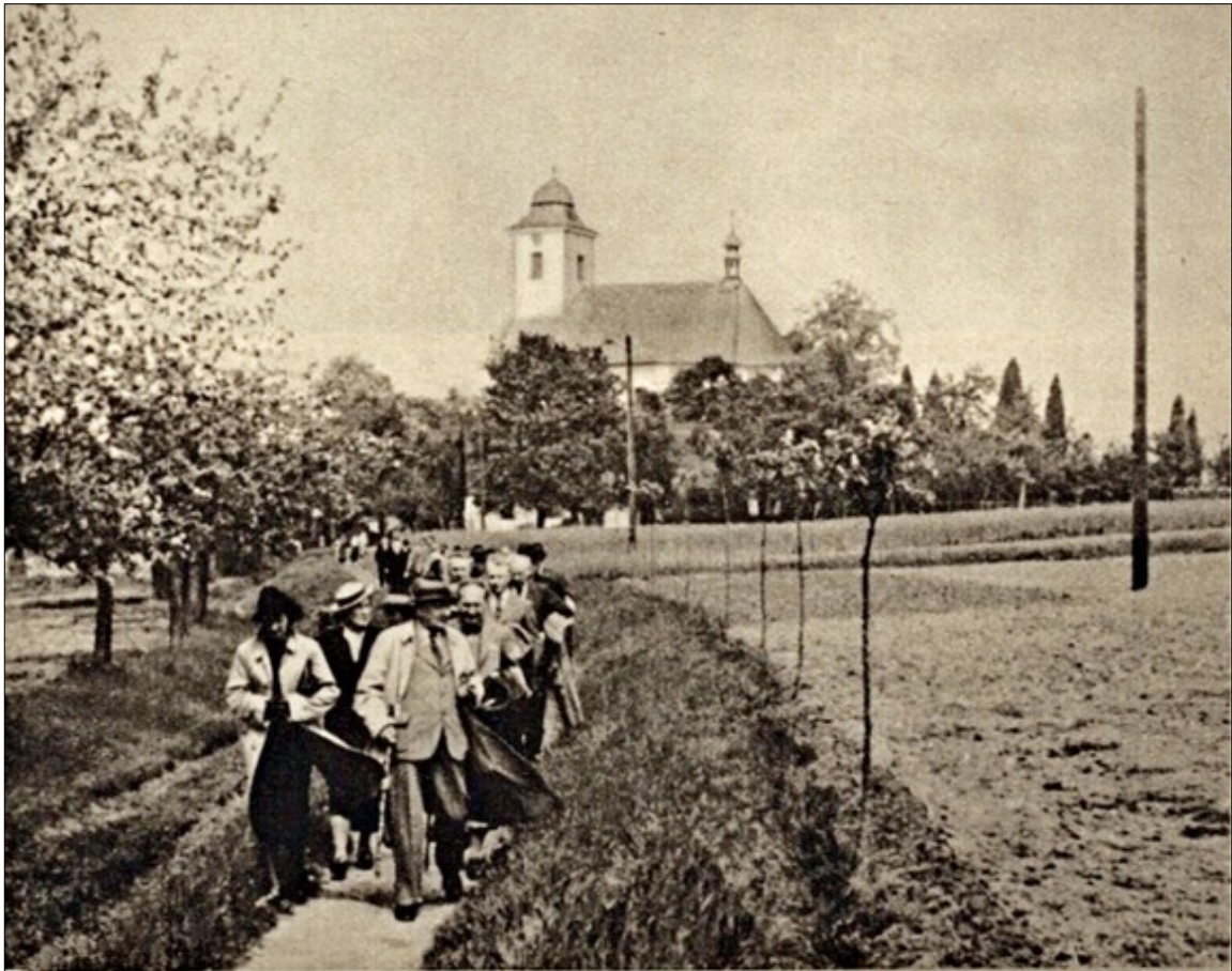
Jenišovický hřbitov, na němž odpočívá Josef Pekař.