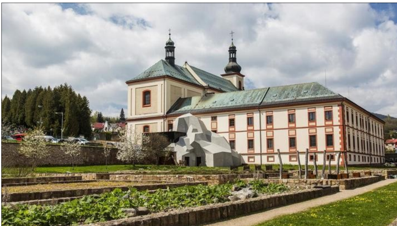
Muzeum Krkonoš se nachází v bývalém augustiniánském klášteře ve Vrchlabí