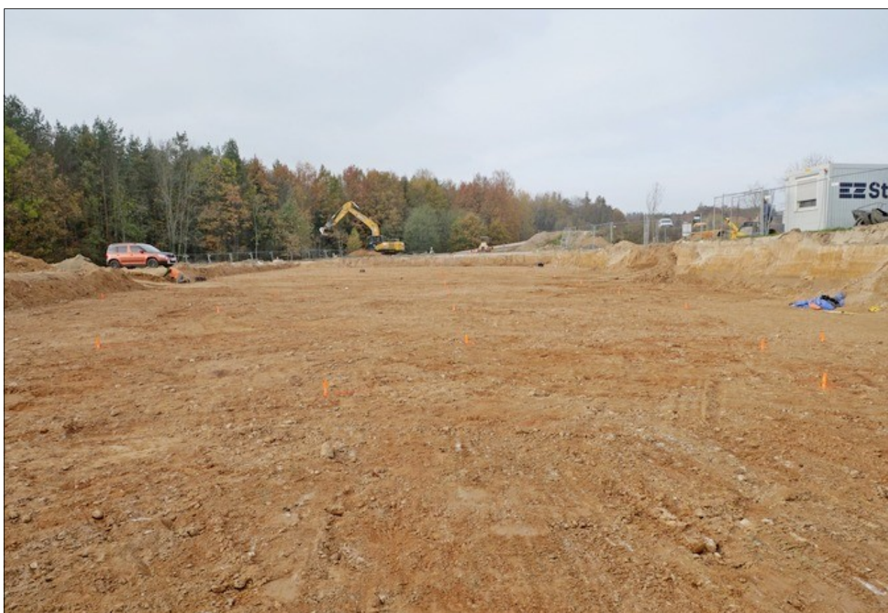
Pohled na zkoumanou plochu se štěrkopískovou terasou, na které se rozkládala lovecko-sběračská stanice