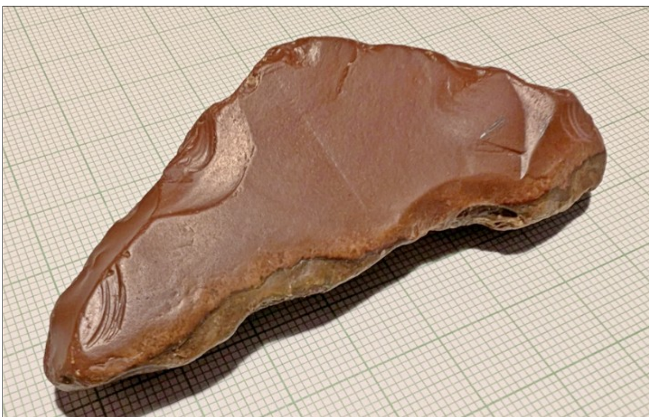
Nález elisovaného jaspisového škrabadla ze zkoumané plochy.

Na přelomu října a listopadu loňského roku došlo při záchranném archeologickém výzkumu na Vesecku k nálezům neběžného měřítka. Výzkum související se stavbou „Integrovaného výjezdového centra Turnov“, jejímž investorem je Liberecký kraj a který realizuje naše archeologické oddělení, navázal na zjišťovací průzkum provedený na jaře. Tehdy se podařilo prokázat přítomnost archeologických objektů zahloubených do jílovité spraše, které můžeme datovat do širokého rozmezí zemědělského pravěku, jejichž přesnou dataci určí až radiokarbonové datování. Těchto objektů se podařilo prokázat 150.