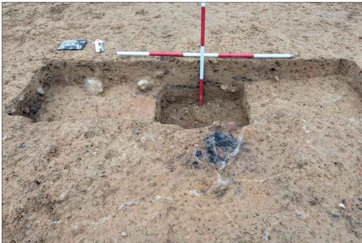
Výzkum jednoho z nalezených objektů prostřednictvím sondy